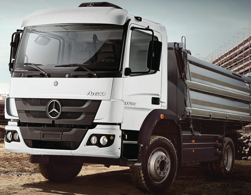
Imagen de referencia, consultar equipamiento.