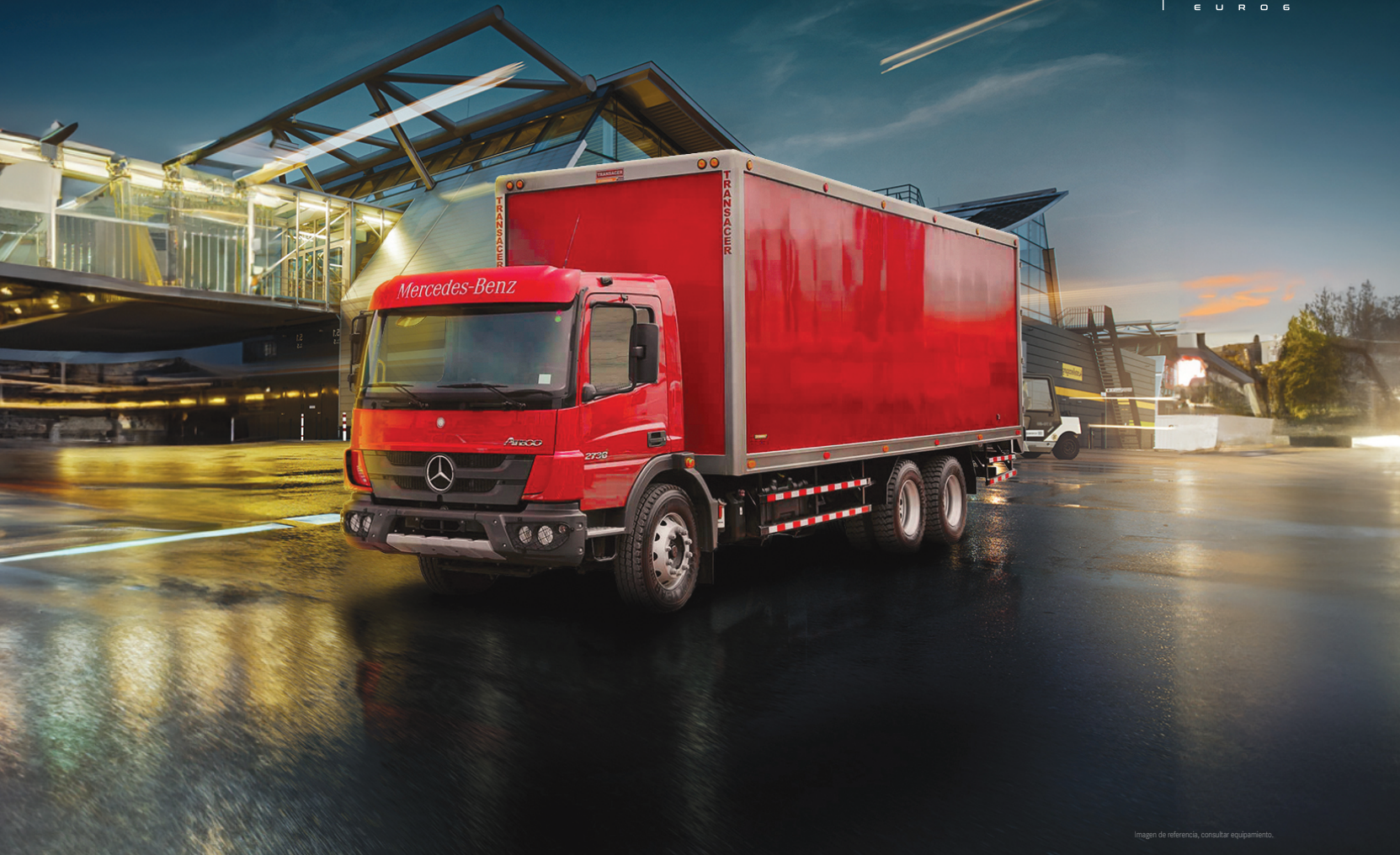
Imagen de referencia, consultar equipamiento.